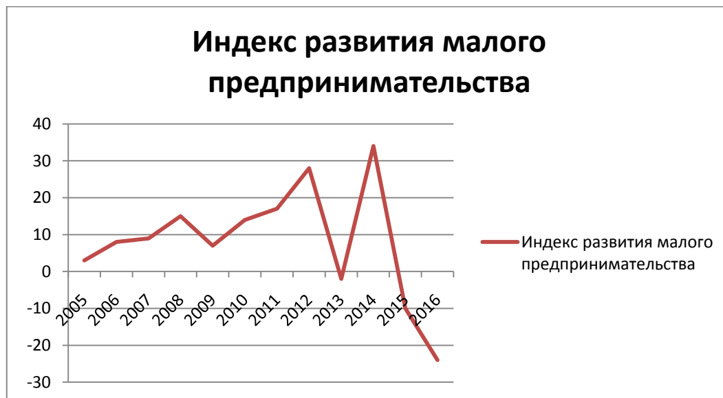
Рис. 1. Индекс развития малого предпринимательства

Представленные значения индекса позволяют выделить в развитии малого бизнеса России несколько этапов: